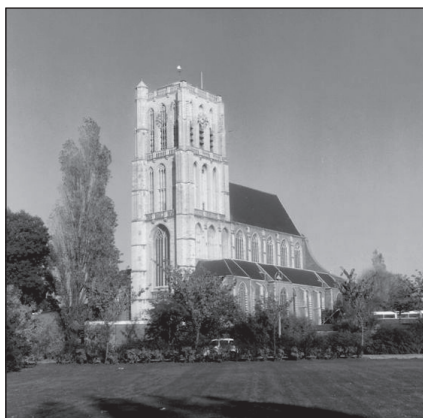
St. Catharijnakerk - Brielle