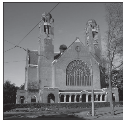
Nieuwe Badkapel - Scheveningen